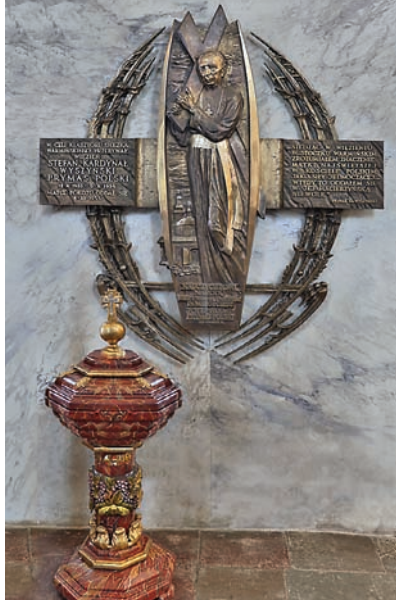
Epitafium Kardynała Stefana Wyszyńskiego

Od 12 października 1953 roku do 6 października 1954 roku władze państwowe więziły w stoczkowskim klasztorze Prymasa Polski Kardynała Stefana Wyszyńskiego. Podczas uwięzienia w Stoczku Klasztornym ksiądz Prymas dokonał, w celi więziennej przed obrazem Świętej Rodziny, Aktu oddania się Matce Najświętszej.