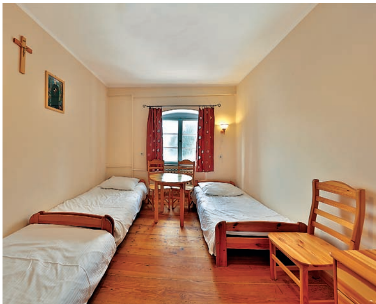
Pokój gościnny w domu pielgrzyma

Klasztor dysponuje 60 miejscami noclegowymi dla grup zorganizowanych, pielgrzymów indywidualnych, turystów i gości. Istnieje również możliwość skorzystania ze wspólnych posiłków, przygotowywanych w kuchni klasztornej. Można również odpocząć w pięknym barkowym ogrodzie klasztornym.