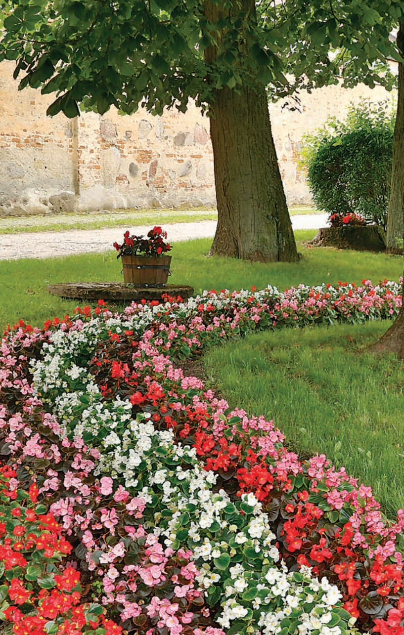
Widok na dziedziniec klasztorny od strony bramy wjazdowej