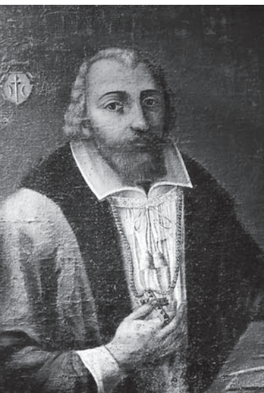
Biskup Mikolaj Szyszkowski

dwie dziewczynki pracujące przy zbiorze siana znalazły w spróchniałym pniu starego dębu figurkę Matki Bożej koloru kości słoniowej. Zanieśli ją do pobliskiej wioski do Stoczka, ale nazajutrz figurka ponownie znalazła się przy dębie. Miejscowy proboszcz, dowiedziawszy się o tym, umieścił figurkę w kościele parafialnym w Kivitach, ale jednak i tym razem powróciła ona na pierwotne miejsce. Zrozumiano wówczas,