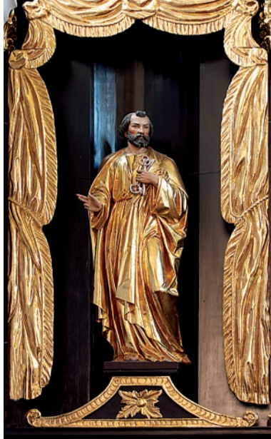
Figura św. Piotra w oltarzu głównym

W 1870 roku przybyli do Stoczka misjonarze św. Wincentego a Paulo z Kolonii, ale po trzech latach, podczas kulturkampfu, zostali wydaleny do Francji, a opiekę nad Sanktuarium stoczkowskim przejęli księża diecezjalni. Po przeprowadzeniu koniecznych remontów zorganizowano w Sanktuarium dom rekolekcyjny. Początkowo korzystali z niego tylko księża, a potem nauczyciele katolicy, dopiero w latach następnych odprawiali tu swoje rekolekcje studenci, uczniowie klas gimnazjalnych oraz młodzież męska.