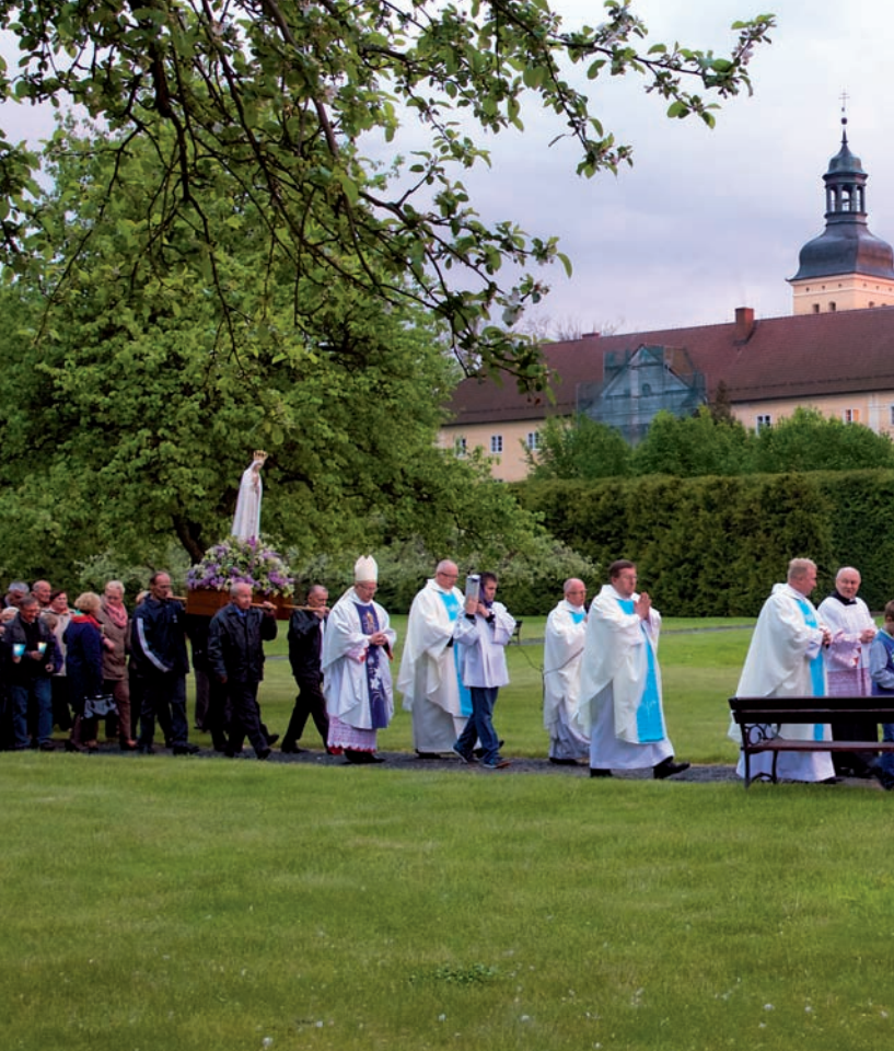
Procesja po ogrodzie klasztornym podczas Nabożeństwa Fatimskiego

Prymasa Tysiąclecia, na nabożeństwa fatimskie każdego 13 dnia miesiąca od maja do października oraz na inne ważne wydarzenia.