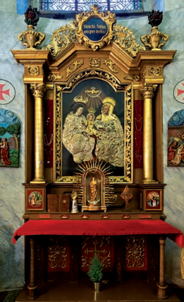
Rotunda (oltarz św. Anny)