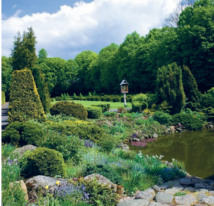
Widok ogrodu od strony klasztoru

Warmii dla jej mieszkańców, jak i dla całej Polski. W miejscu, gdzie od ponad 370 lat jest czczony obraz Matki Pokoju i gdzie był uwięziony 66 lat temu Sługa Boży Kardynał Stefan Wyszyński Prymas Tysiąclecia.