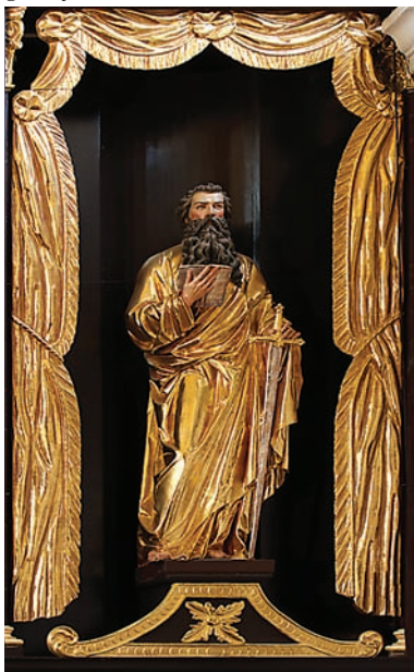
Figura św. Pawła w oltarzu głównym