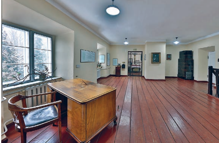
pierwsze i drugie) na dole kaplica więzienna