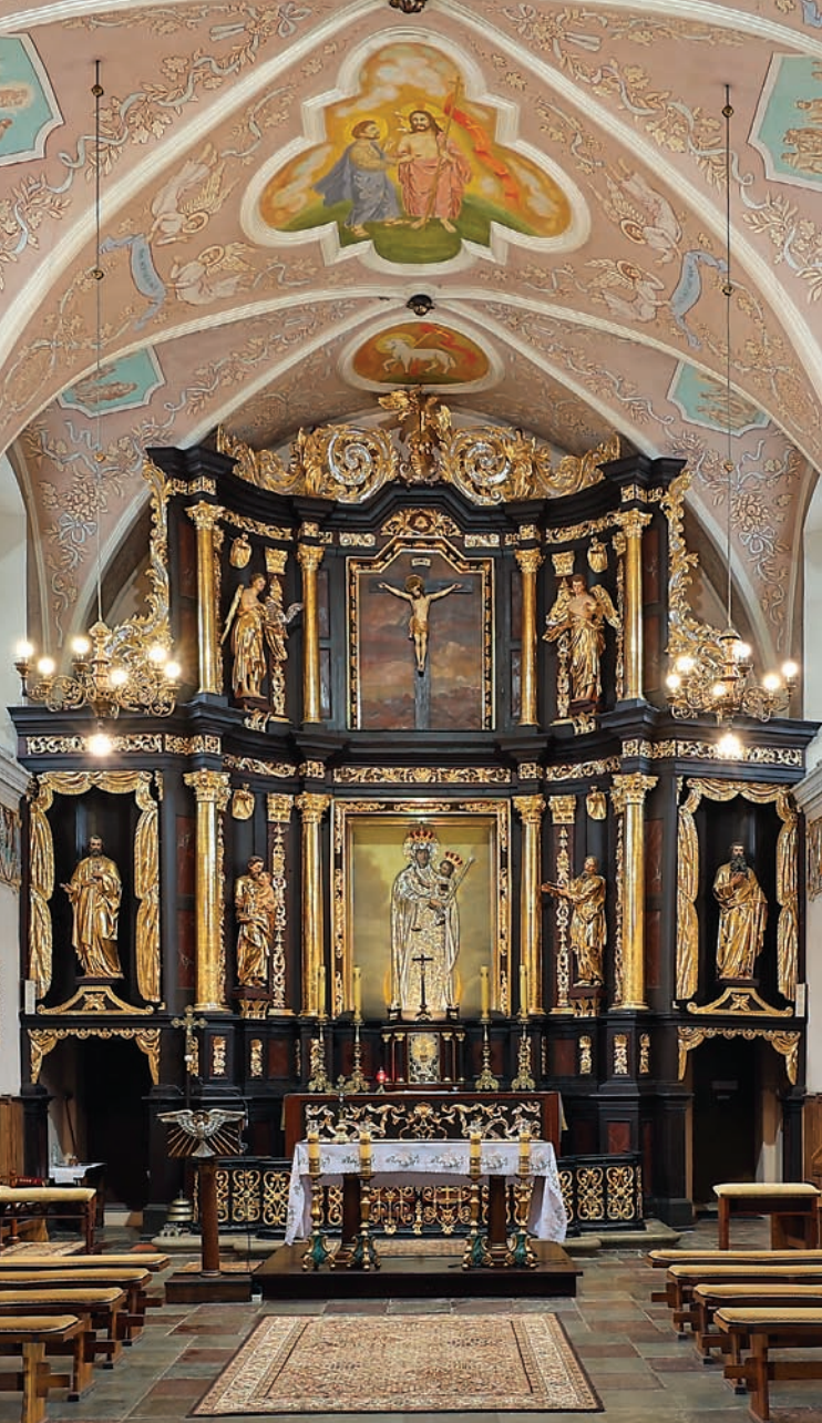
Ołtarz główny po renowacji w 2013 roku