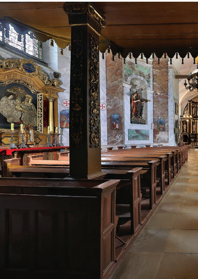
Ogólny widok rotundy i prezbiterium