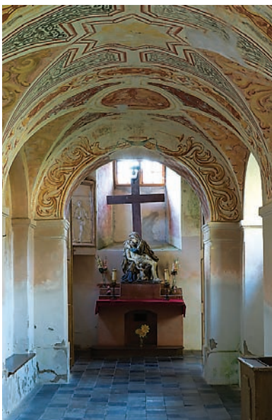
Krużganki (kaplica św. Jana Kajetana - Pieta z Koblencki)