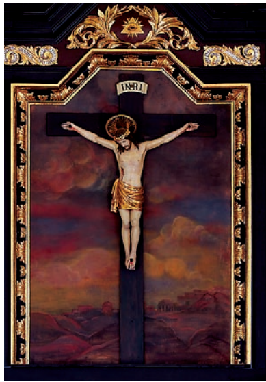
Krucyfiks w oltarzu głównym

Na skutek pierwszego rozbioru Rzeczypospolitej Stoczek znalazł się pod zaborem pruskim, wrogo nastawionym do polskości, katolicyzmu i pobożności maryjnej. Na mocy dekretu kasacyjnego z 30 października 1810 roku władze pruskie przejęły na skarb państwa posiadłość ziemską obejmującą 12 hektarów gruntów, klasztor i świątynię, a 4 kwietnia 1826 roku w obecności tysięcy wiernych Sanktuarium zostało zamknięte. Po 15 latach