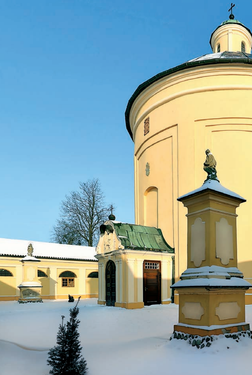
Zimowy widok rotundy od strony dziedzińca