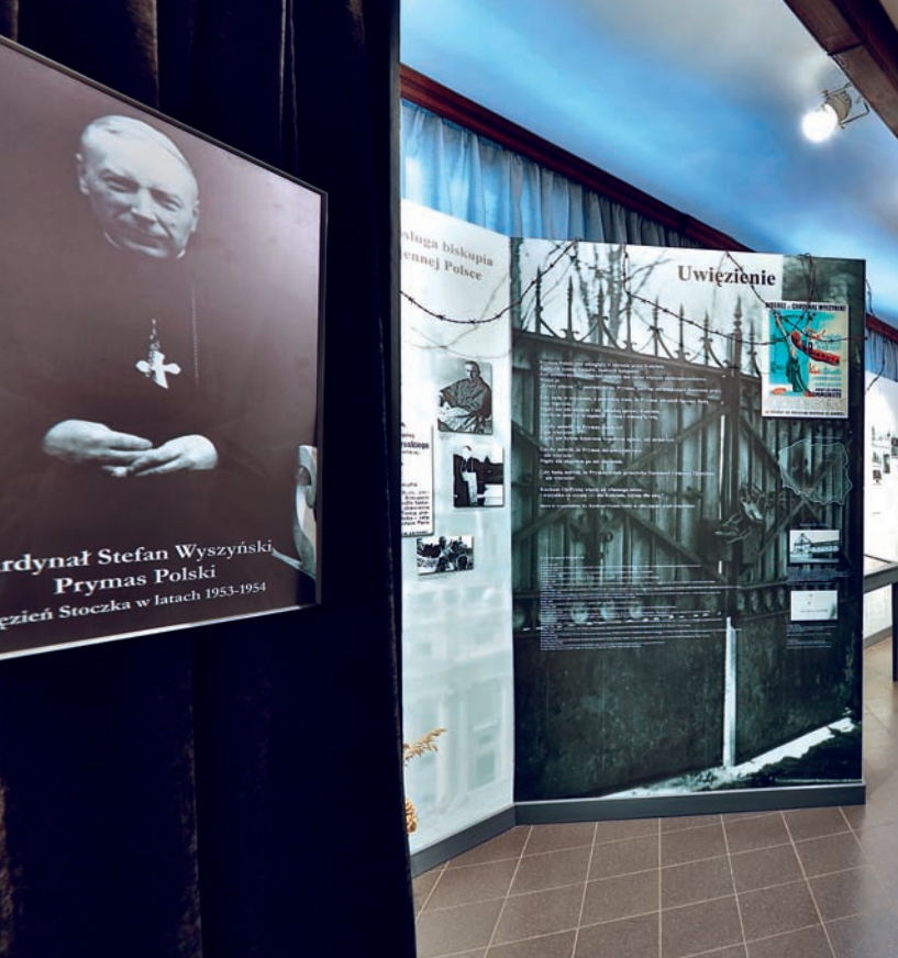
Izba Pamięci Sługi Bożego Kardynała Stefana Wyszyńskiego (pomieszczenie