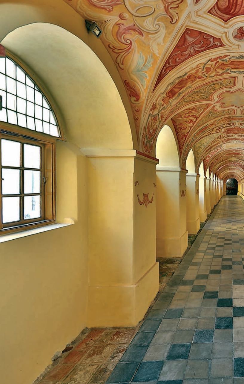
Krużganki wokół Bazyliki (skrzydło odnowione w 2012 roku)