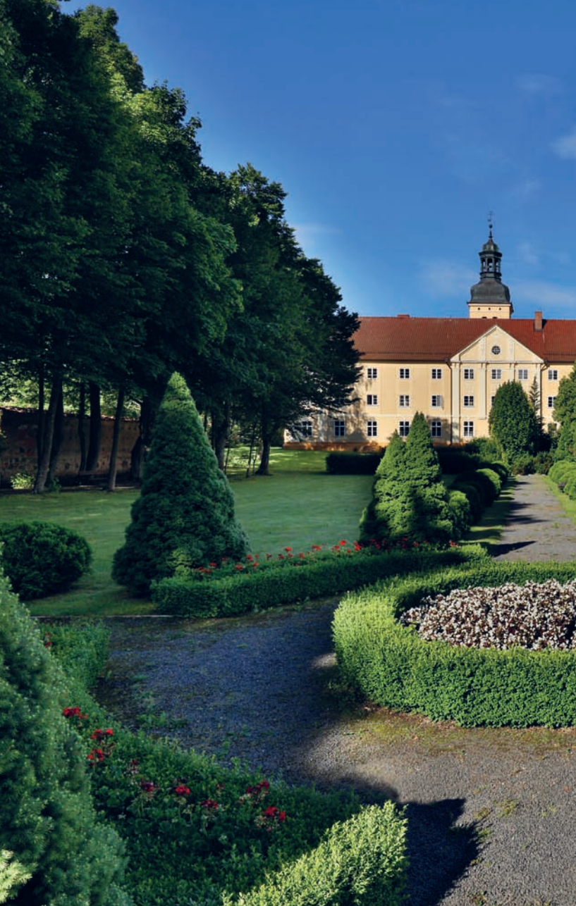
Ogród klasztorny w wiosennej scenerii