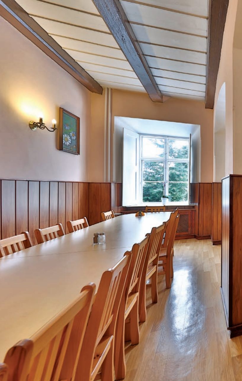
Jadalnia dla pielgrzymów i gości