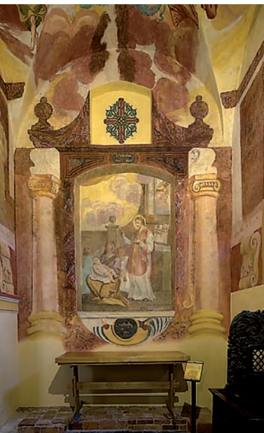
Kruźganki (kaplica św. Walentego)

napływających pielgrzymów, okazał się za mały i trzeba go było powiększyć. Dokonał tego przełożony klasztoru o. Chryzostom Watson, dzięki wsparciu biskupa Teodora Potockiego.