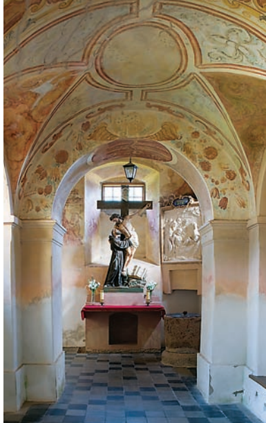
Krużganki (kaplica św. Jana Nepomucena - św. Franciszek pod krzyżem)