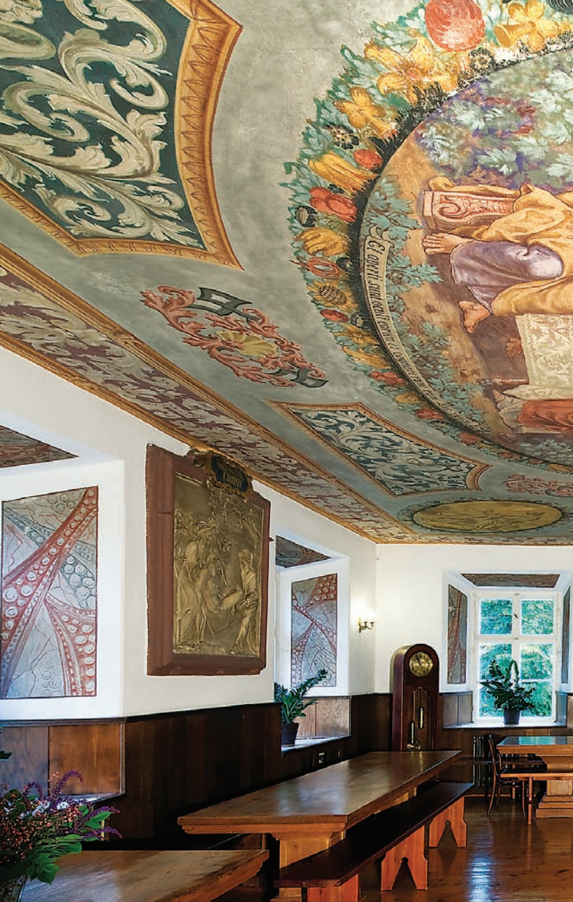
Refektarz klasztorny z XVII wieku