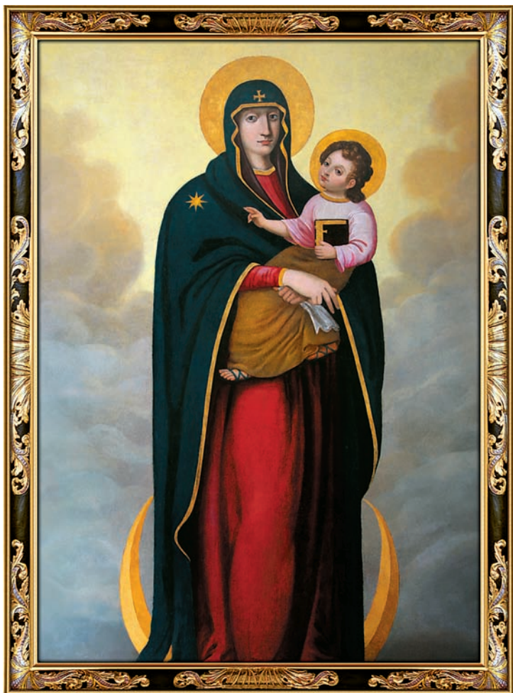
Obraz Matki Pokoju bez szaty