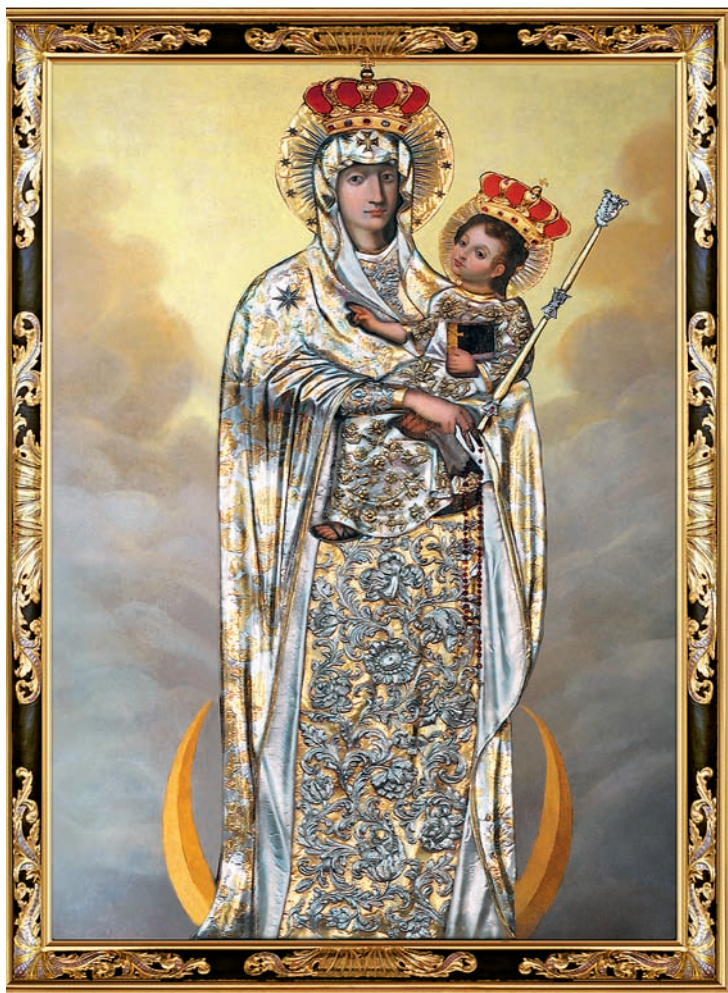
Obraz Matki Pokoju w nowej szacie poświęconej w 2013 roku