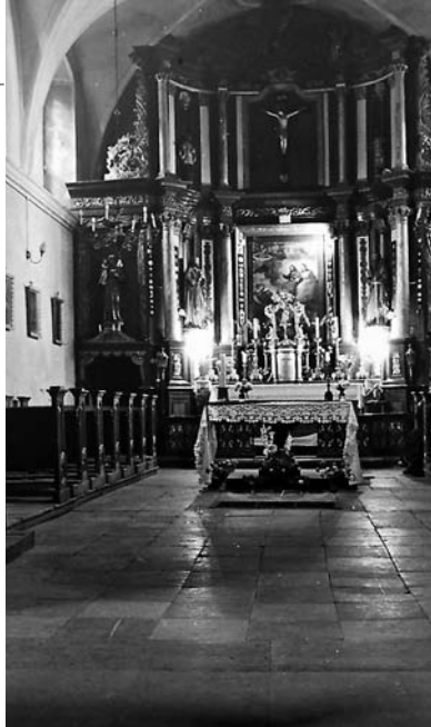
Ołtarz główny (fot. z pocz. XX w.)

Wkrótce jednak klasztor okazał się za mały i następny biskup warmiński Jan Wydźga w 1666 roku, w siedemsetną rocznicę Chrztu Polski, ufundował większy, murowany klasztor. Także kościół, ze względu na dużą liczbę