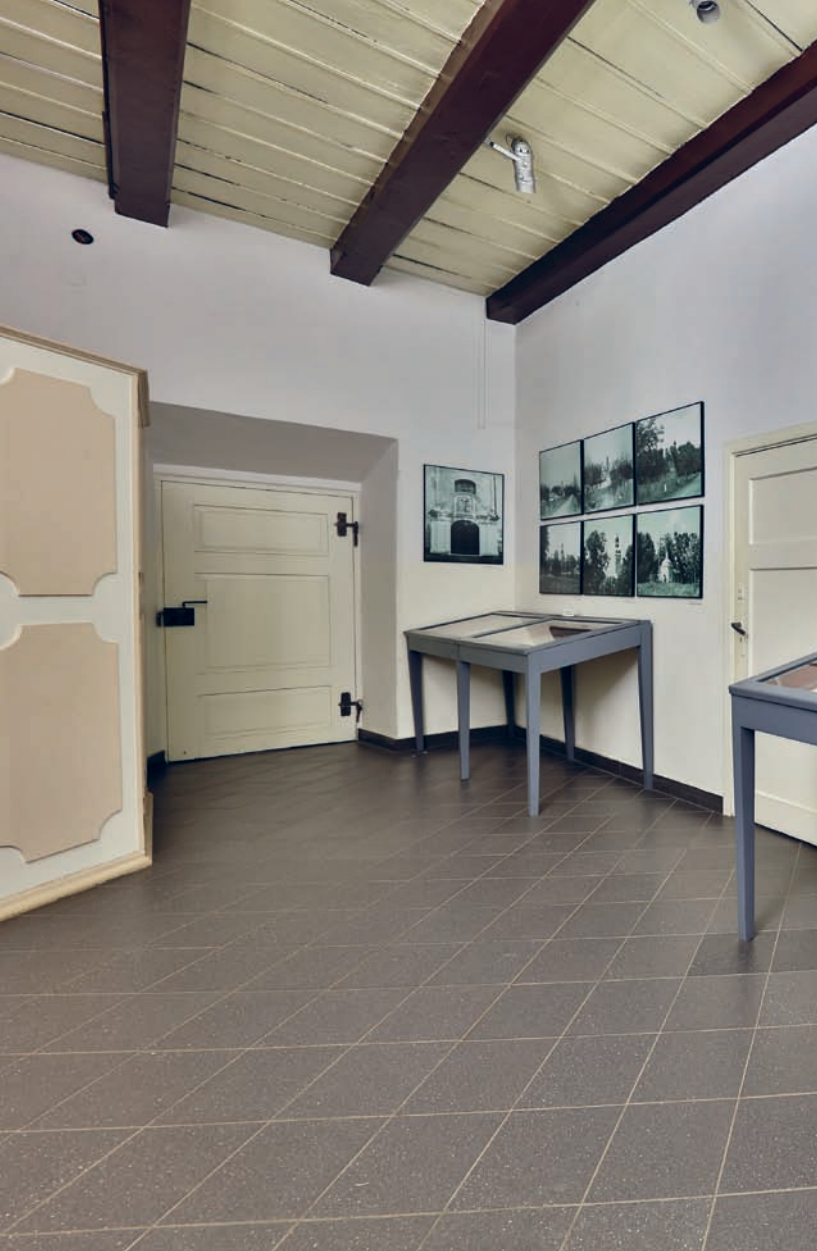
Izba Pamięci Sługi Bożego Kardynała Stefana Wyszyńskiego (pomieszczenie