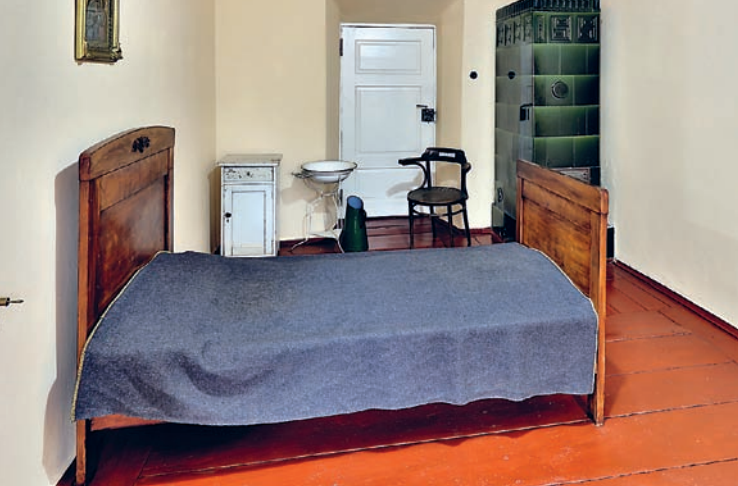
Cela więzienna Sługi Bożego Kardynała Stefana Wyszyńskiego (pomieszczenie