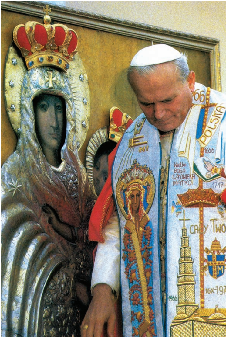
Koronacja Obrazu Matki Bożej Królowej Pokoju przez św. Jan Pawła II w Częstochowie 19 czerwca 1983 roku