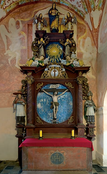
Kruźganki (kaplica Krzyża Świętego)