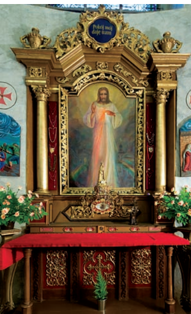
Rotunda (oltarz Jezusa Miłosiernego)